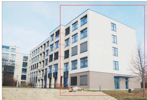
Das Bauteil 400 (rot gekennzeichnet) vergrößert das Georgius-Agricola Klinikum Zeitz.

Das Georgius-Agricola Klinikum Zeitz wurde im Februar 2000 nach fünfjähriger Bauzeit eröffnet. Der medizinische Komplex hat 290 Betten. Benannt ist das Klinikum nach Dr. Georgius Agricola, der sich große Verdienste bei der Bekämpfung der Pest erwarb und im Zeitzer Dom bestattet ist. Im Georgius-Agricola Klinikum Zeitz werden jährlich ca. 11.000 stationäre und ca. 19.000 ambulante Patienten behandelt. Das Georgius-Agricola Klinikum ist von einem Park umgeben. Im hinteren Teil des Parks wurde im Umfeld zweier Teiche ein Bienenlehrgarten angelegt, oberhalb des Bienenlehrgartens entstand ein Kräutergarten.