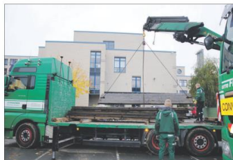
Im Oktober 2016 wurden die vorgefertigten Module geliefert.

! Sie sanieren oder bauen ein Objekt mit Hilfe regionaler Firmen und wünschen einen Baureport? Schreiben Sie uns an redaktion@wochenspiegel-zeitz.de