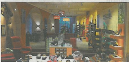
Im Röder Schuhhaus und Orthopädie gibt es modische Schuhe, Schuhe mit herausnehmbarem Fußbett und Schuhe in verschiedenen Weiten für Damen und Herren

Außerdem haben Interessierte auf der Messe „Aktiv mit 50plus“ die Gelegenheit, vom Orthopädie-Schuhmachermeister kostenlos per Scan einen Abdruck ihrer Füße erstellen zu lassen. Dieser wird dann im gemeinsamen Gespräch ausgewertet, und es wird gezeigt, mit welchen Hilfsmitteln man noch lange schmerzfrei stehen und laufen kann. Gerade für diejenigen, die noch sportlich aktiv sind, ist es sinnvoll, durch eine Maßeinlage die Fußgesundheit zu unterstützen und eventuell schon bestehende Beschwerden zu lindern.